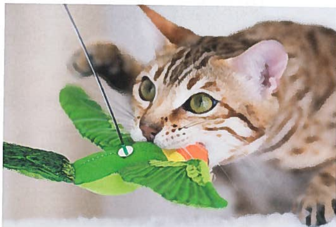
Leikkiminen on sisäkissan hyvinvoinnille erittäin tärkeää.

Raapiminen ja kynsien teroittaminen ovat olennainen osa kissan käyttäytymistä. Kynsien teroittaminen on kynsien hoitamista, mutta samalla myös viestintää. Hajuviestintä on kissoille hyvin tärkeää, ja hajuviestinnässä tärkeä keino on raapiminen. Kissat raapivat merkatakseen hajulla ja visuaali-