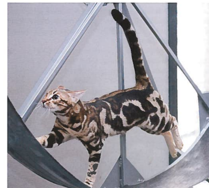
Juoksupyörä tarjoaa virikkeitä ja liikuntaa.

Kissalla on matala kynnyks vaania ja korkea kynnyks syödä.