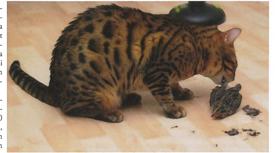
Pakastelinnulla leikkiminen ja sen nakartaminen tyydyttävät kissan saalistusviettiä, vaikkei kissa ymmärtäisikään lintua syödä.

Tätä selittää se, että luonnossa kaksi kolmesta saalistusyrityksestä epäonnistuu. Tarve käyttäytyä näkyy joskus käytösongelmana – kissa voi kohdistaa saalistuskäyttäytymistarpeensa omistajaansa. Käsiin ja jalkoihin tarraavat pennut saattavat olla suloisia, mutta ihmiseen kohdistuvaa hyökkäilyä ei kannata milloinkaan vahvistaa omalla käytöksellään, ei edes kissaa rankaisemalla.